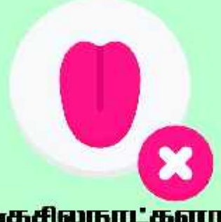
வெகுசில நாட்களாக சுவை அறியாத்தன்மை