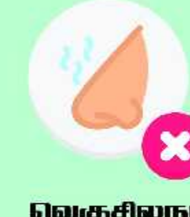
வெகுசில நாட்களாக வாசனை அறியாத்தன்மை