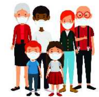
குடும்ப உறுப்பினர்கள் அனைவரும் முகக்கவசம் அணிய வேண்டும்