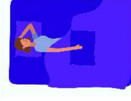
தனிமைப்படுத்திக் கொண்டு ஓய்வெடுக்க வேண்டும்