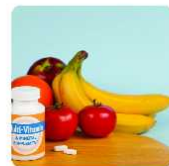
வைட்டமின் & பினரல் சத்துள்ள உணவு மற்றும் மாத்திரைகள் எடுத்துக்கொள்ளவும்