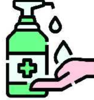
கிருமி நாசினி கொண்டு கைகளை அடிக்கடி கழுவுவேண்டும்