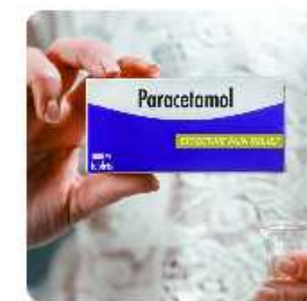
6 மணி நேரத்திற்கு ஒருமுறை பேராசிட்டமால் மாத்திரை மற்றும் இருமல் மருந்து தேவைப்பட்டால் உட்கொள்ளவேண்டும்