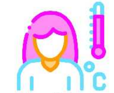
4 மணிநேரத்திற்கு ஒருமுறை உடல் வெப்பநிலை பரிசோதிக்க வேண்டும்