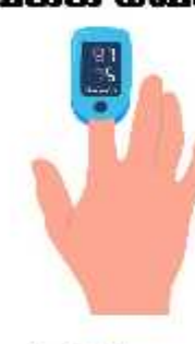
4 மணிநேரத்திற்கு ஒருமுறை ஆக்ஸிமீட்டர் கொண்டு திரைத் ஆக்ஸிஜன் செறிவு பரிசோதிக்க வேண்டும்