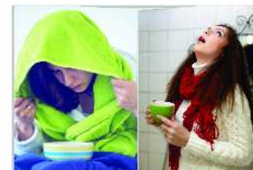
நாள் ஒன்றுக்கு மூன்றுமுறை ஆக்சிபிடித்தல் மற்றும் வெதுவெதுப்பான நீர் பயன்படுத்தி கொப்பளிக்கவும்