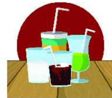
தண்ணீர், பழச்சாறு கடி மற்றும் இளநீர் பருகவும்