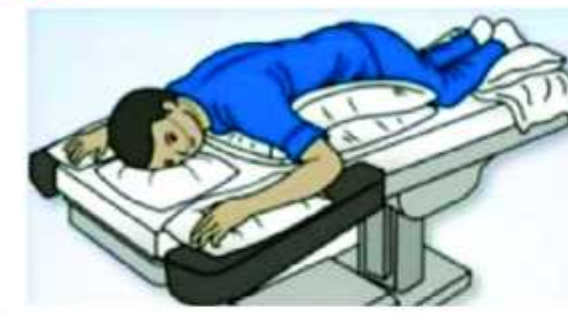
கனிழந்து படுத்து நன்கு சுவாசிப்பதன் மூலம் திரைத் ஆக்ஸிஜனின் அளவை அதிகப்படுத்தலாம்